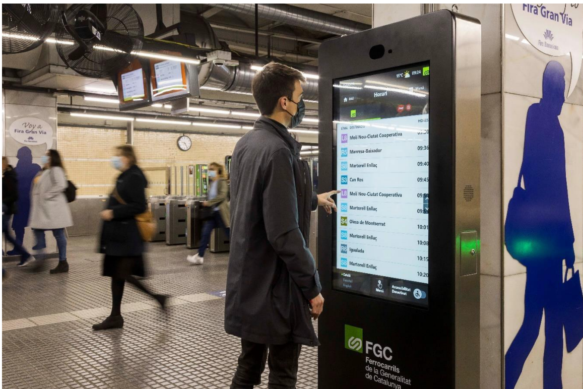
Quiosco interactivo en la estación de Pl. España.

Ferrocarrils de la Generalitat de Catalunya (FGC) ha puesto en servicio los nuevos quioscos interactivos de información en sus estaciones para mejorar la atención a las personas usuarias y facilitar la experiencia del viaje con transporte público. Estas instalaciones proporcionan en tiempo real datos de interés para las personas usuarias en el momento de viajar cómo son los horarios, las incidencias, las alteraciones programadas del servicio o posibilidades para completar el viaje con otros operadores.